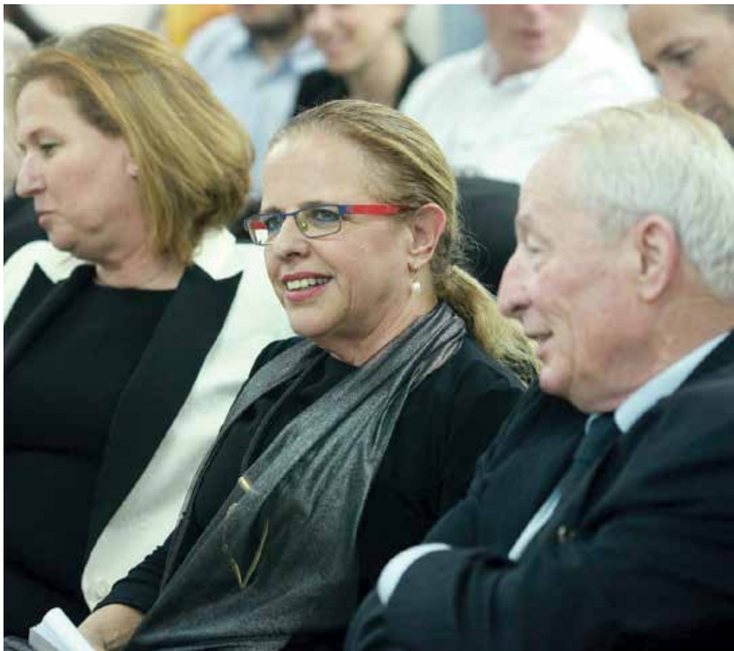
"השיפוט לא חסר לי". בטקס חנוכת הנציבות עם היועץ וינשטיין והשרה לבני, מאי 2014

לא מעט. עד היום אין שום מערכת תמיכה מינהלית ורגשית בשופט. עוזר משפטי אחד לשופט מחוץ עמוס לא מספיק, צריך לפחות שניים. מעבר לזה, הציבור הכללי ואפילו עורכי הדין לא יודעים ששופט רגיל