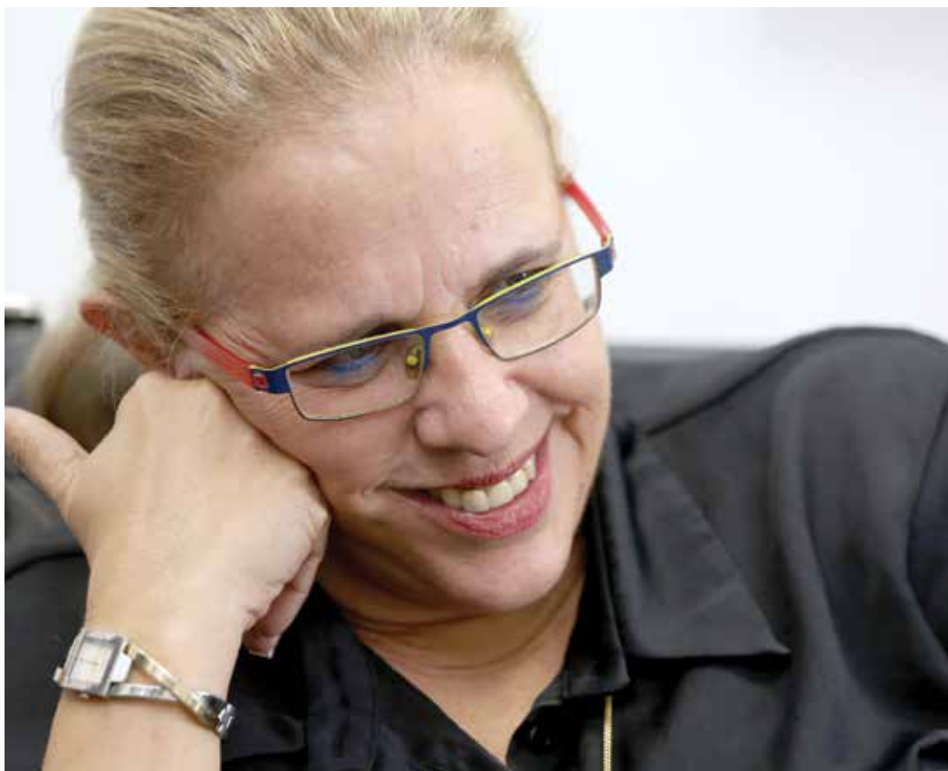
"היתרון הוא שהיום אני יודעת מה נכון שיהיה בחוק כשיבשיל הזמן לחקיקתו". גרסטל

אותו דבר כאן. ברגע שיש גוף מבקר שבא עם ביקורת אובייקטיבית, מקצועית, שקר־פה ואמיתית, צריך לשמוח ולא להצטער. לכן אני גם חושבת שהשמות של הנילונים לא צריכים להתנוסס בראש חוצות. אין כוונה להלבין את פניהם אלא להצביע לפ־ניהם על נקודה שבה לא פעלו כראוי, כדי שהדבר לא יקרה שוב.